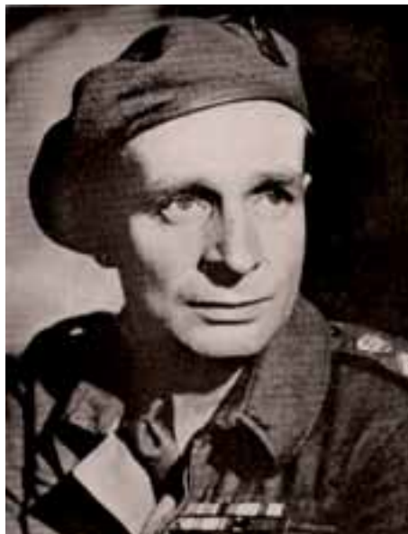
Laurence van der Post.