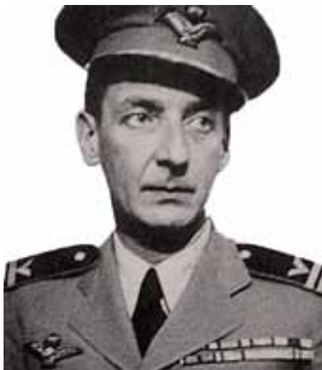
Laszlo de Almasy.