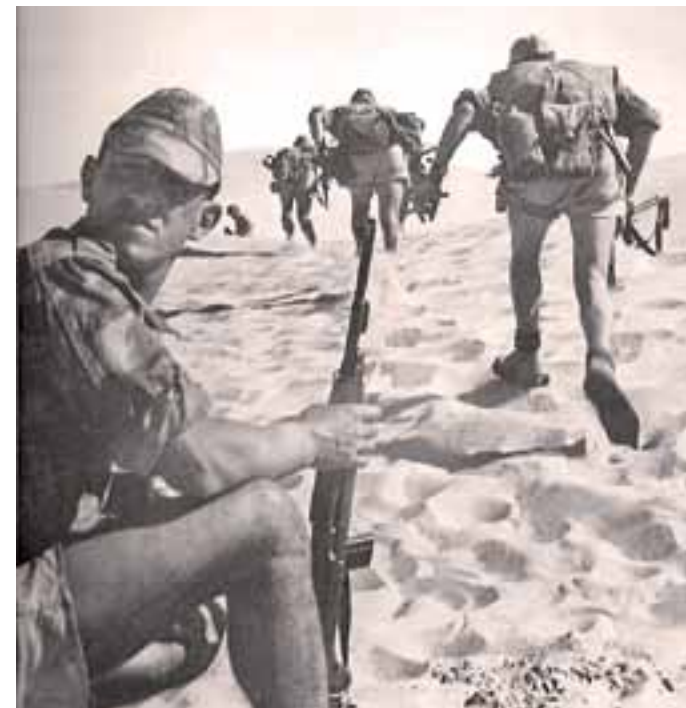
Grupo Selous Scout.

En ambos conflictos, naturalmente muchos cazadores profesionales se ofrecieron voluntarios para combatir por sus países. Poseían los conocimientos necesarios para moverse con soltura en el campo, sabían de armas, hablaban idiomas nativos