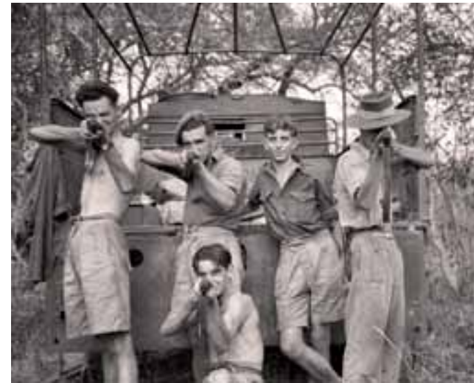
Patrulla durante la rebelión Mau Mau.

La lucha en Rhodesia se extendió de 1964 a 1979, y combatió a la guerrilla del ZIPRA y ZANU, que culminó con la creación de Zimbabwe y la entronización del dictador Robert Mugabe. En Sudáfrica, la guerra fue de 1966 a 1990 contra la guerrilla UNITA y SWAPO, que desembocó en la independencia de Namibia.